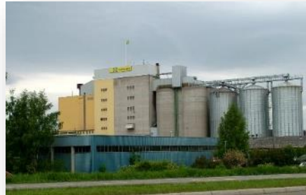
Fornybar energi i egen drift