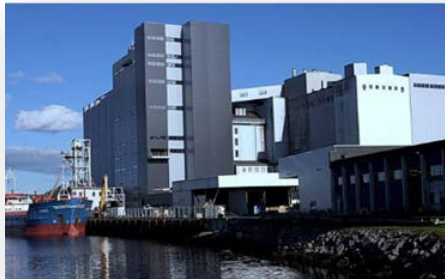
Effektivisering av kraftfôrproduksjon