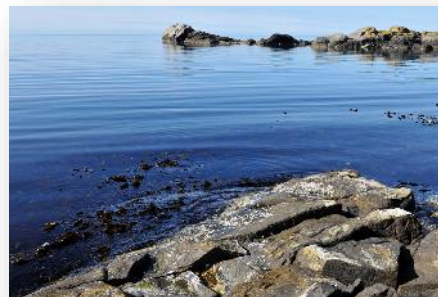
Foods of Norway